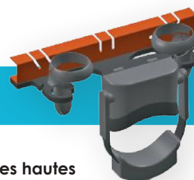
5 casques hautes performances

Une intégration optimisée des appareils VR/AR et de leurs manettes